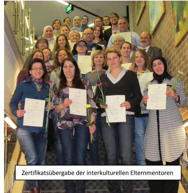
Zertifikatsübergabe der interkulturellen Elternmentoren

Tipp: Mehrsprachige Materialien für Kitas und Schulen finden Sie auf www.wegweiser-beruf.de → dort „Schulen“ anklicken